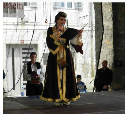
Prireditev »Festival bosanske kulture in kulinarike« Ženskega združenja Bedem 6. 6. 2015 v Taverni v Kopru.