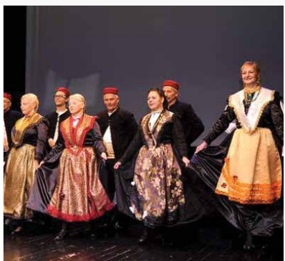
Nastop HKD »Istra« Piran 12. 10. 2015 v Požegi, Slavonija, Hrvaška.