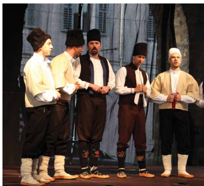
Nastop društva AKUD Kolo s SKUD Sv. Sava iz Niša, Srbija 16. 10. 2015 v Taverni Koper.