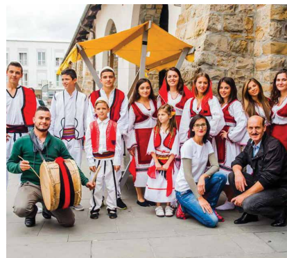
Nastop in udeležba KD Iliria na prireditvi Zavoda Krog »Od potice do baklave« 10. 10. 2015 v Taverni v Kopru.