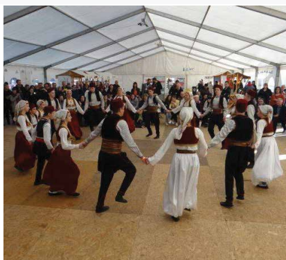
Nastop KUŠD Behar na prireditvi Zavoda Krog »Od potice do baklave« 19. 12. 2015 v Ankaranu.