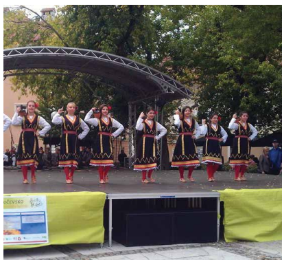
Nastop MKD Kočo Racin na prireditvi Doživite Kočevsko 26. 10. 2015 v Kočevju.